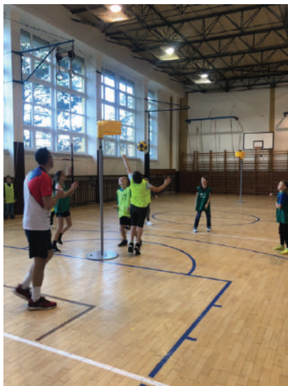
Zkušební hodiny korfbalu