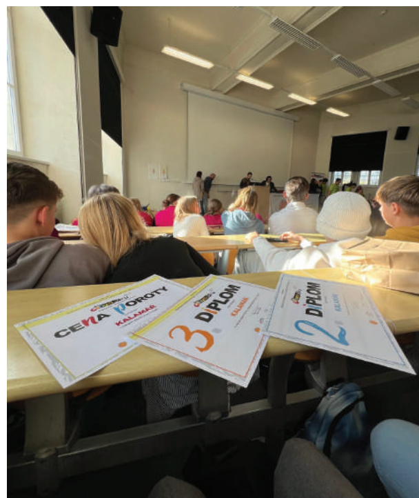
Naše úspěchy pohromadě