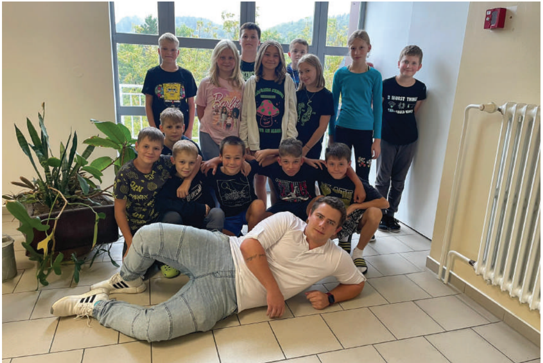
Třída 6.C v celé své kráse s panem učitelem třídním

Moje oblíbené předměty jsou zeměpis, dějepis a matika.