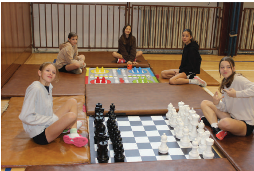
Velkoplošné stolní hry jsou novinkou školy

Nechybělo zapojení audiovizuální techniky do výuky. V odborných učebnách chemie, fyziky a přírodopisu byly k vidění různé pokusy a prezentace, do kterých se mohl každý zapojit. Živo bylo zvláště v učebně chemie, kde to bublalo, dýmilo, vonělo, v akci byly různé pokusy, např. důkaz tekutosti plynu, malování pomocí elektrolýzy, vrcholem byl start rakety Space-X.