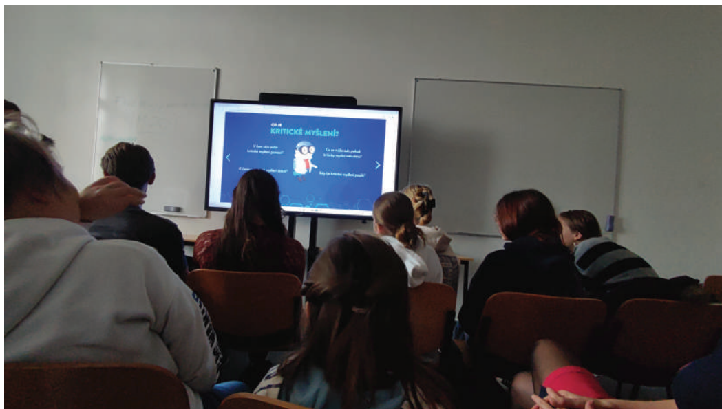
Zúčastnili jsme se workshopu na téma "Fake news"

zpáteční cestu domů, která však byla komplikovaná. Na autobusové zastávce jsme čekali půl hodiny a holky chytly hyperaktivitu, protože pořád mluvily a byly hlučné. V autobuse jsme skoro všichni usnuli. Nebylo divu, bylo to náročné! V Novém Jičíně nám ujel jediný bus do Frenštátu, proto jsme museli