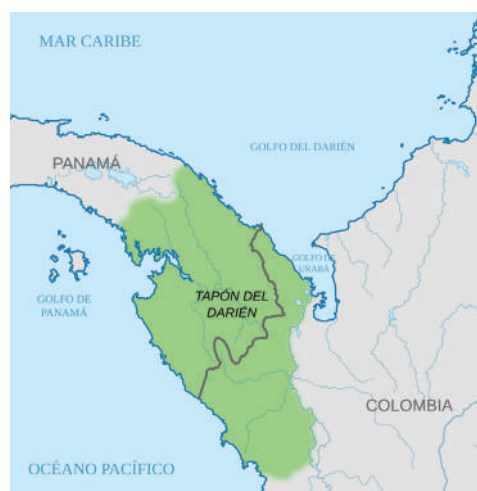
Mapa Darién Gap

Těžko říct, zda se Darien gap dá považovat za dobré nebo špatné místo, ale myslím si, že je to zajímavé místo plné přírodních krás, ale bohužel i nebezpečných kartelů.