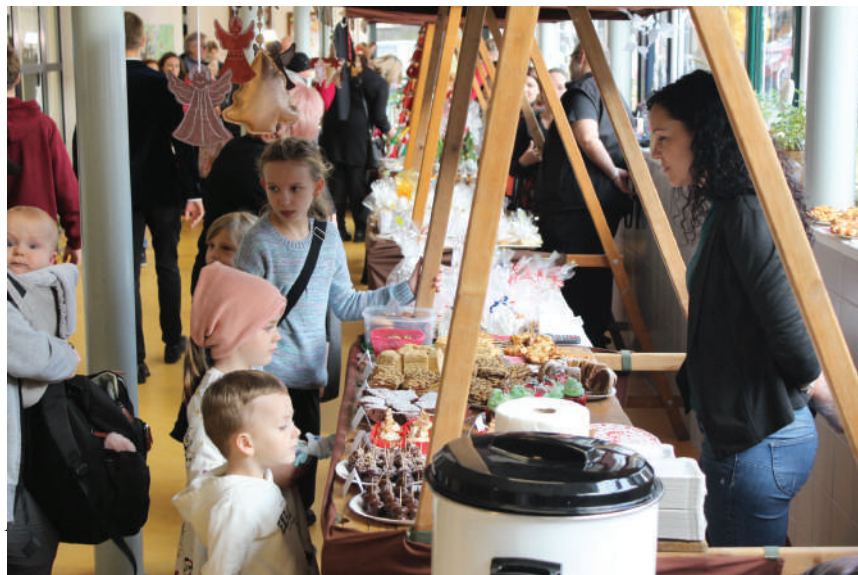
Družina si připravila jarmark plný výrobků na prodej

O kulturní program se také postaraly děti z mateřské školy Školská a Dolní. Sboreček Mateřídouška z MŠ Školská svým pěveckým vánočním programem plným koled a zimních