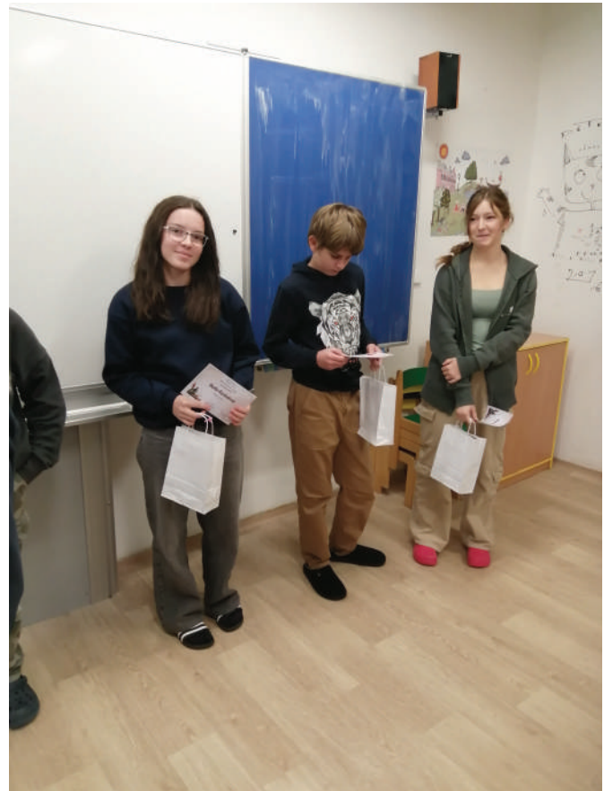
Byla to skvělá zkušenost, i když jsme se neumístili