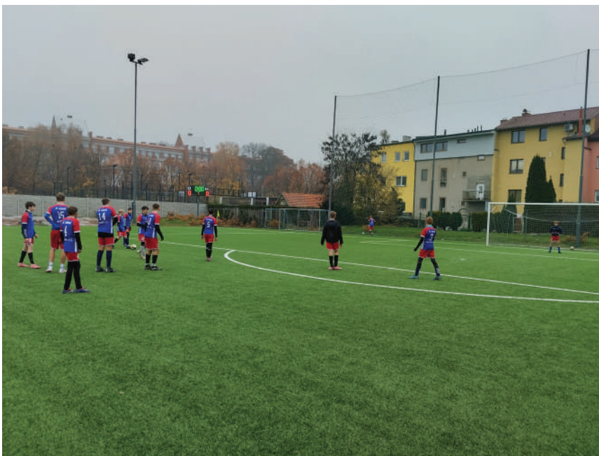
Mladší žáci během fotbalového turnaje

Finálového klání se zúčastnily tyto školy: ZŠ Záhuní Frenštát p.R., ZŠ