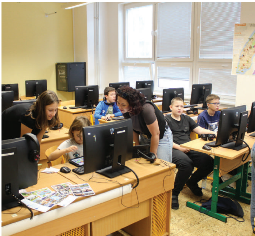
Ukázka kreativních hodin angličtiny nadchly veřejnost

Děkujeme všem návštěvníkům za jejich návštěvu a přízeň. Velké poděkování patří také všem zaměstnancům a žákům, kteří se podíleli na tomto výjimečném dni.