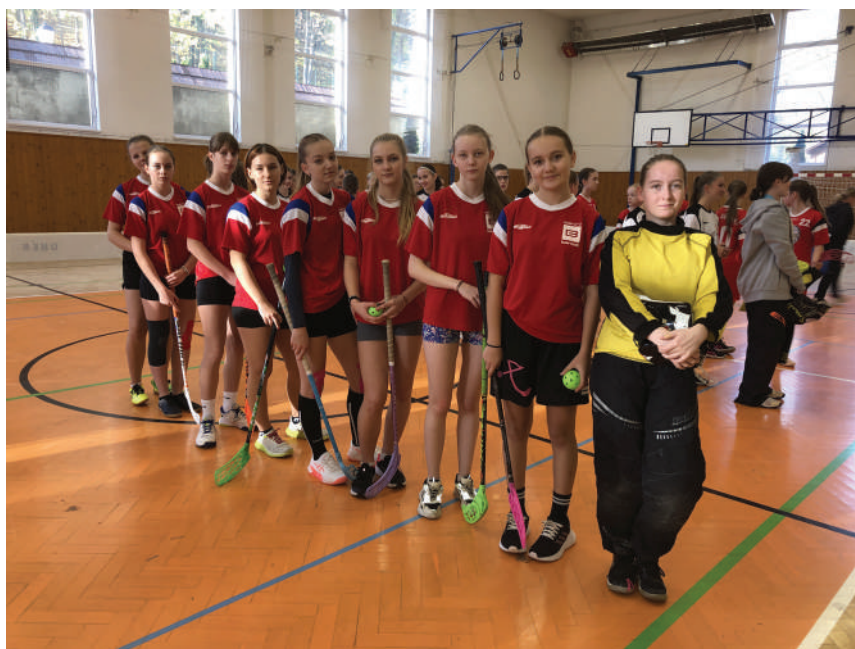
Naše dívky čekající na vyhlášení výsledků

Devítičlenné dívčí družstvo složené z holek osmého a devátého ročníku jelo do Štramberku reprezentovat naši školu na okrskové kolo ve florbale. Dívky hrály proti ZŠ Emila Zátopka (Kopřivnice), ZŠ Alšova (Kopřivnice) a ZŠ Štramberk. Hrací doba byla 2x8 minut. První zápas jsme prohrály 2:5 s těžkým soupeřem ZŠ Emila Zátopka, ale dívky měly radost ze dvou vstřelených gólů. Druhý zápas byla jasná výhra 3:0 proti ZŠ Štramberk. Nejdůležitější zápas byl proti ZŠ Alšova, kde se nám jednalo o 2. místo, tudíž možný postup. Zápas byl velice napínavý a skončil remízou 3:3. Bohužel, ZŠ Alšova vyhrála na skóre a tím pádem nás posunula na hezké 3. místo. Děkujeme dívkám za pěkné výkony, vzájemnou spolupráci a fair play.