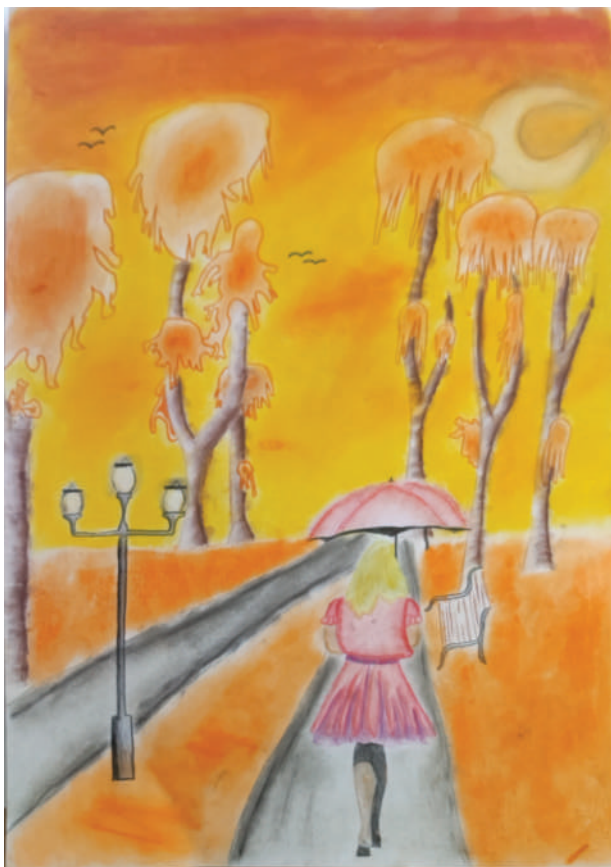
Tomáš Vlček, VI.B