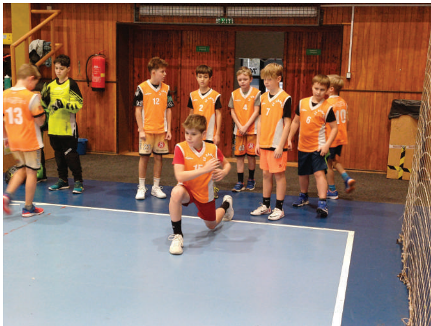
Kluci se rozvíčují před svým zápasem

podlehli ZŠ Jičínská Příbor a poté remizovali s Gymnáziem Příbor. Zisk jednoho bodu nám k postupu do semifinále nestačil, a proto jsme nastoupili už jenom k zápasu o páté místo. Proti ZŠ Galaxie Nový Jičín jsme roli favorita splnili a celkově obsadili 5. místo.