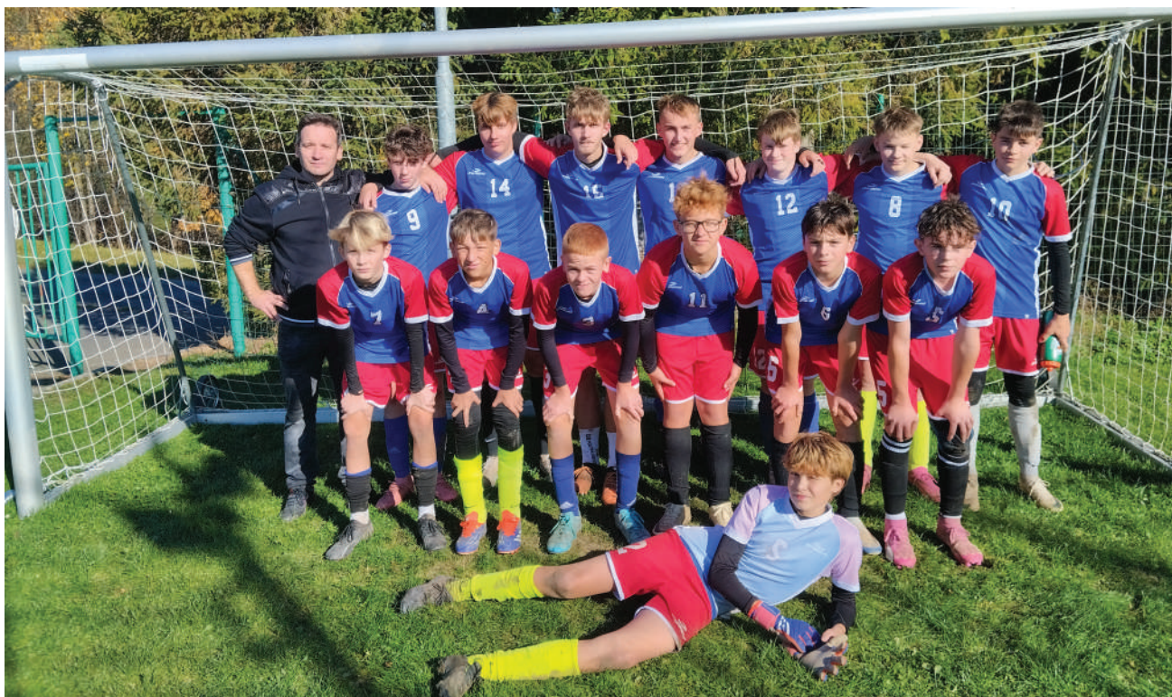
Společná fotka žáků, kteří reprezentovali naši školu ve fotbalovém turnaji