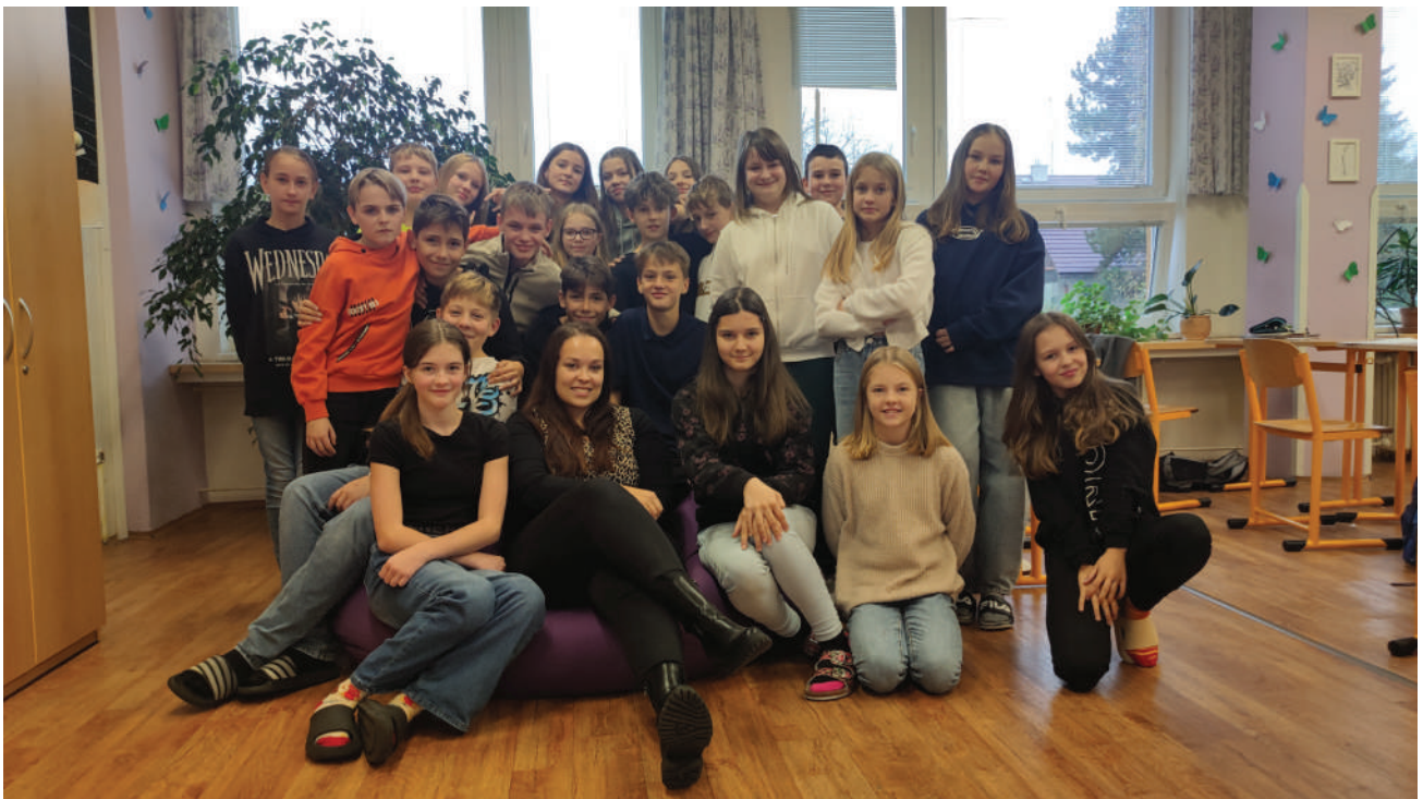
Třída 6.D s paní učitelkou třídní ve své třídě

Vyznám se tu, ale hodně mě tu plete stěhování. Je to pro mě velká změna.