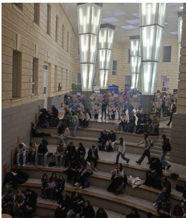
Interiér budovy byl úchvatný