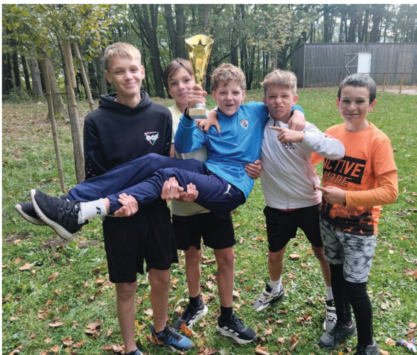
Mladší žáci slavili svůj úspěch