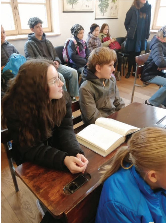
Při zahájení jsme se dozvěděli základní informace