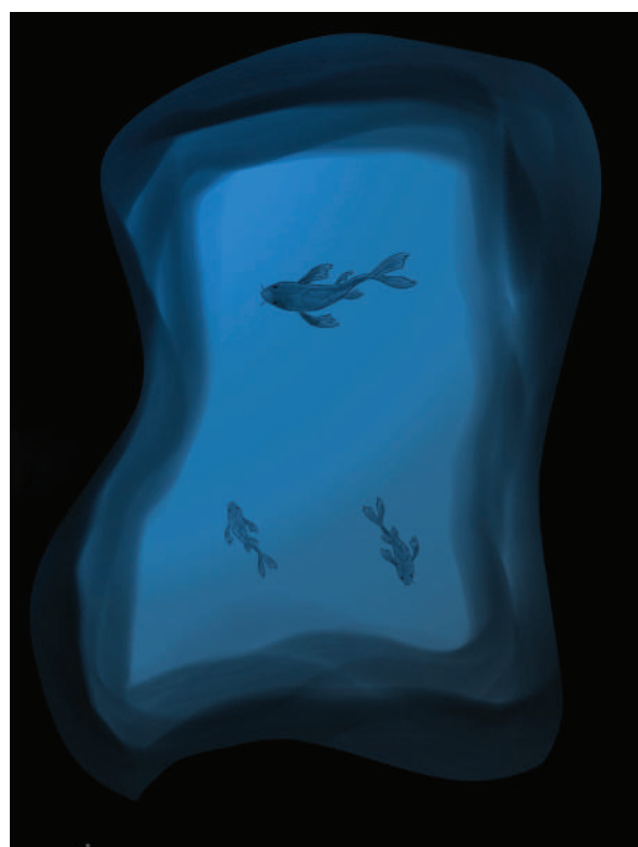
Štěpán Brož, IX.B